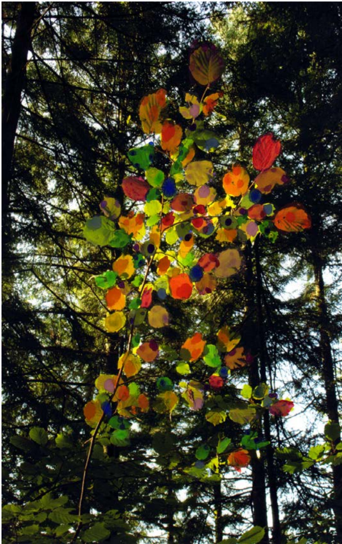
Displace violently or send flying, Eva-Fiore Kovacovsky, 2009 Represents to me the multiplicity of natures.